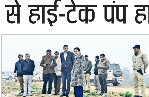
गुहला-चीका। डीसी अपराजिता घग्गर और सरस्वती क्षेत्र का निरीक्षण करते।

डीसी अपराजिता ने मंगलवार को गुहला उपमंडल के बाढ़ संभावित संवेदनशील इलाकों का दौरा किया। इस दौरान उन्होंने सिंचाई विभाग के अधिकारियों के साथ घग्गर नदी, सरस्वती नदी और विभिन्न तटबंधों (बंधों) का निरीक्षण किया। डीसी ने स्पष्ट किया कि प्रशासन का मुख्य लक्ष्य यह सुनिश्चित करना है कि आगामी मानसून सीजन में बाढ़ की स्थिति दोबारा पैदा न हो। डीसी ने सबसे पहले टटियाणा गेज का