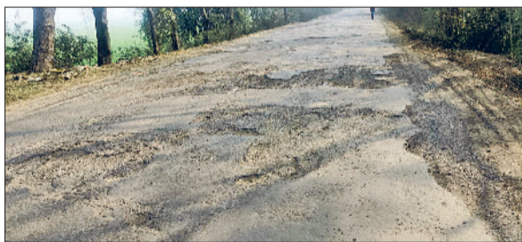
सीवन। कैथल मार्ग पर नगर के पास खस्ता हाल सड़क।

कैथल-पटियाला मुख्य मार्ग इन दिनों पूरी तरह से बदहाली का शिकार हो चुका है। सीवन से कैथल के बीच सड़क पर बने गड्ढे और जानलेवा गड्डों ने इस मार्ग को मौत का रास्ता बना दिया है। हालात ऐसे हैं कि वाहन चलते समय नीचे से सड़क से टकरा रहे हैं, जिससे कभी भी बड़ा हादसा हो सकता है। स्थानीय लोगों का कहना है कि यह सड़क बहुत लंबी मांग और भारी सरकारी खर्च के बाद बनाई गई थी, लेकिन घटिया निर्माण के कारण बेहद कम समय में ही टूटकर जर्जर हो गई। स्टेट हाइवे होने के बावजूद सड़क की गुणवत्ता पर कोई ध्यान