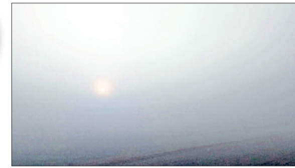
जींद। धुंध के बीच से गुजरते वाहन।