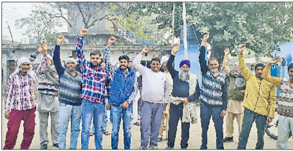
राइस मिल प्रदूषण के खिलाफ सदरहेड़ी गांव के ग्रामीणों का आक्रोश।

गतिविधियों को नियंत्रण करने के लिए पुलिस ने व्यापक प्रबंध किए हैं। होटलों, रेस्टोरेंटों पर रहेगी विशेष नजर, 15 नाके लगाए: पुलिस ने होटल, रेस्टोरेंट, ढाबों एवं धर्मशालाओं पर अलग से विशेष सुरक्षा बंदोबस्त किए गए हैं। जिला में अलग-अलग विशेष स्थान चिन्हित करके जिला में 15 नाके स्थापित किए गए हैं। जिला जींद में यातायात व्यवस्था को सुचारू रूप से चलाने के लिए यातायात प्रभारी को विशेष दिशा निर्देश दिए गए हैं।